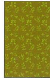
1. Jahr: Einsaat auf kompletter Fläche, keine Pflege