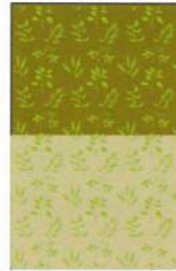
2. Jahr: Neueinsaat auf 50 % der Fläche, 50 % keine Pflege