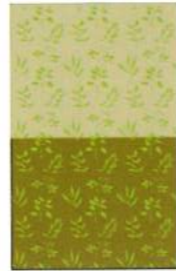
3. Jahr: Neueinsaat und Brachefläche werden getauscht

Mit der ab 2019 neu eingeführten Maßnahme Blüh-, Brut- und Rückzugsflächen („Lebensraum Niederwild“) in das Förderprogramm für Agrarumwelt, Klimaschutz und Tierwohl (FAKT) fördert das Land Baden-Württemberg Landwirte, die Flächen aus der Produktion nehmen und dafür mehrjährige Lebensräume für Feldhase, Feldvögel und Insekten schaffen.